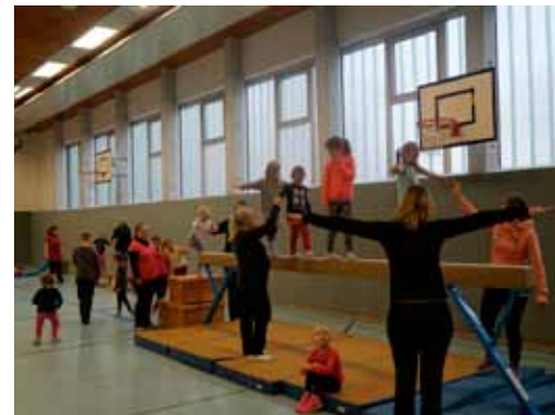
Viel Spaß hatten die Kinder beim Nikolausfest der KiTa „Kleine Strolche“

Der Kindergarten und der Sportverein Damshagen hatten am 2. Dezember 2017 zum traditionellen Nikolaussportfest eingeladen. Die Turnhalle war etwas kalt, aber sie war richtig voll – mit so einer großen Resonanz hatten die Organisatoren wirklich nicht gerechnet. Ein gelungener Abschluss des gemeinsamen Projektes „Kinderbewegungsland“ in diesem Jahr.