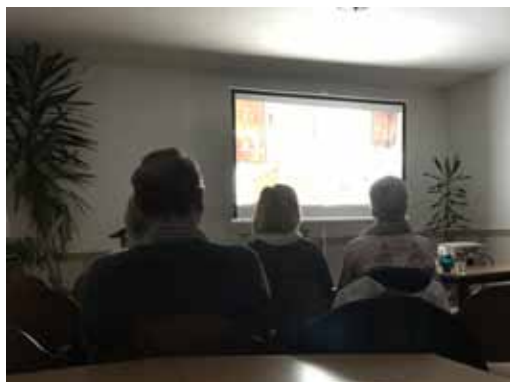
Noch bis März monatliches Kinovergnügen im Pfarrhaus