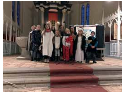
Krippenspiel in der St.-Thomas-Kirche in Damshagen

Der Kindergarten und der Sportverein Damshagen hatten am 2. Dezember 2017 zum traditionellen Nikolaussportfest eingeladen. Die Turnhalle war etwas kalt, aber sie war richtig voll – mit so einer großen Resonanz hatten die Organisatoren wirklich nicht gerechnet. Ein gelungener Abschluss des gemeinsamen Projektes „Kinderbewegungsland“ in diesem Jahr.