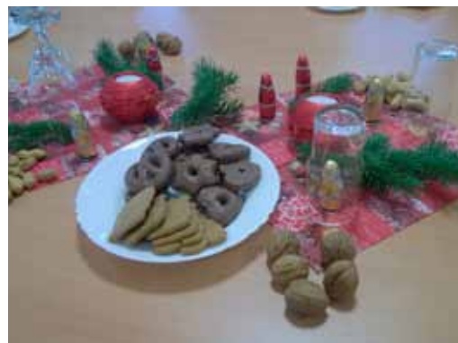
Festlich gedeckter Tisch bei der Seniorenweihnachtsfeier

Impressum: Hg: Gemeinde Damshagen; V.i.S.d.P: Mandy Krüger, Bürgermeisterin; Redaktion: Uta Stockdreher, Mandy Krüger, Viola Dobberschütz, Katharina Weste, Thorsten Menkenhagen; Layout: Uta Menkenhagen; Auflage: 1000; Internet: www.damshagen.info (Gemeinde), jcd.damshagen.info (Jugendclub), www.svdamshagen.de (Sportverein)